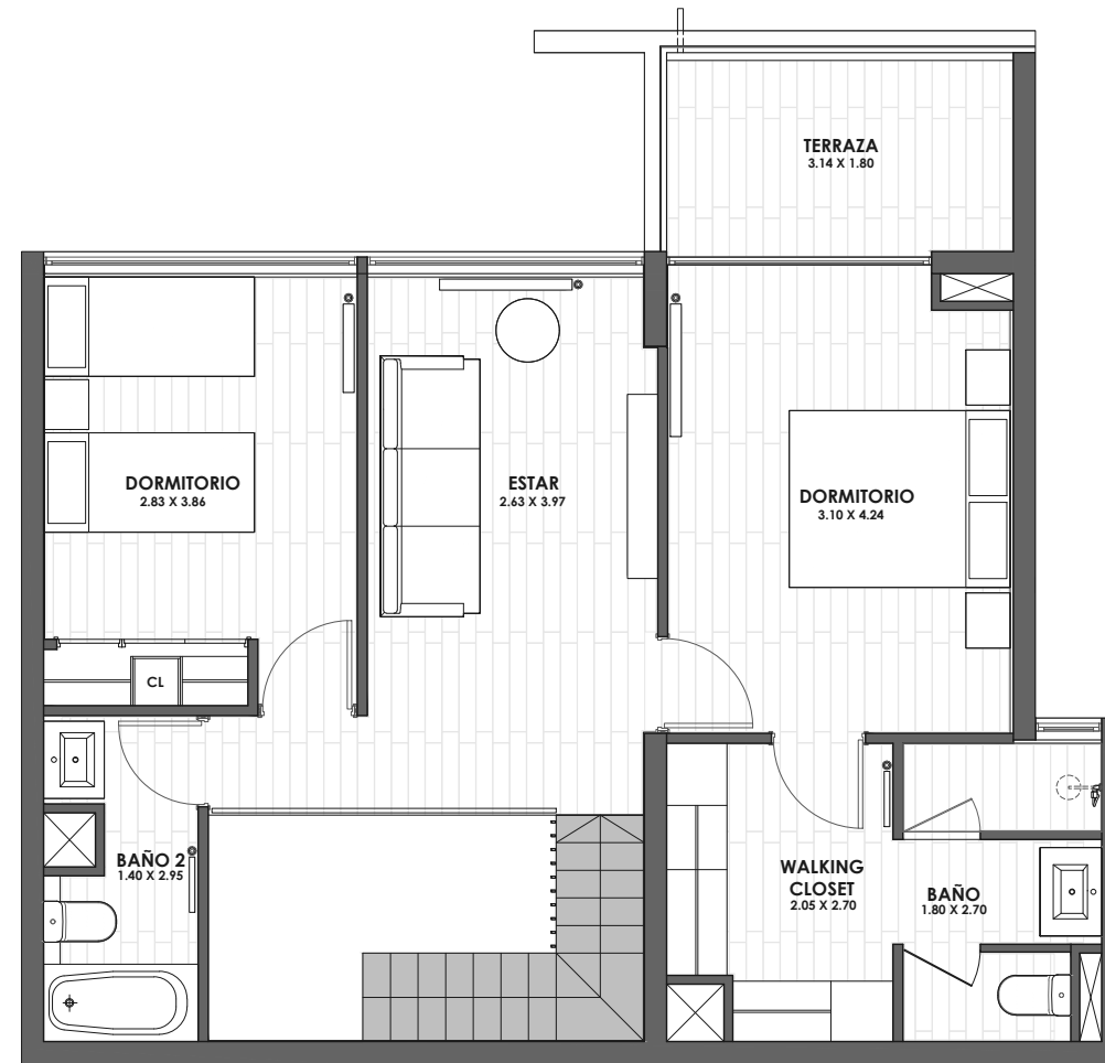
NIVELES SUPERIORES (PISO 3º Y 5º)

Nota: * Las dimensiones indicadas son referenciales a obra gruesa y medidos a los recintos preponderantes